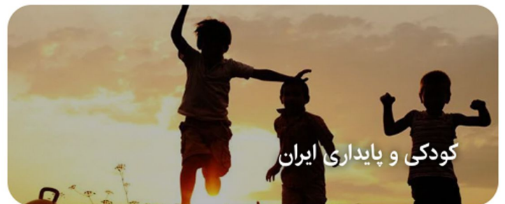
کودکی و پایداری ایران