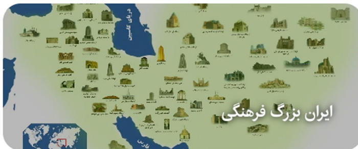
ایران بزرگ فرهنگی